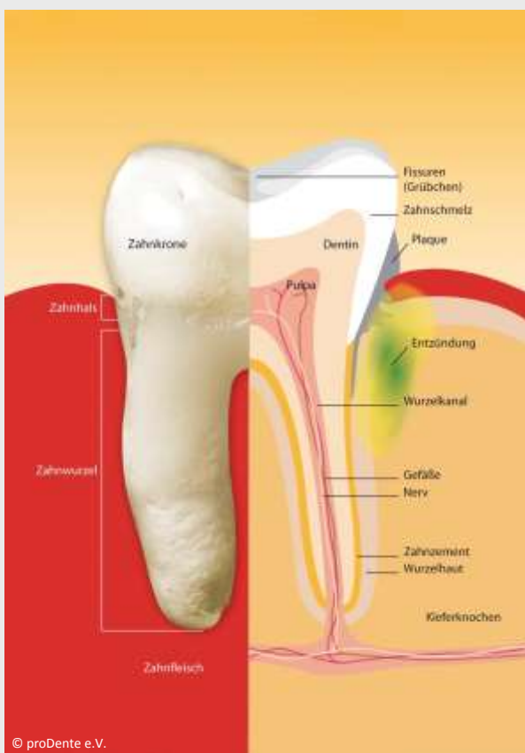
Bakterien in Plaque und Zahnstein führen zu Entzündungen und Zahnfleisch-Taschen

genetische Risiko-Tests mittels Labor-Untersuchungen.